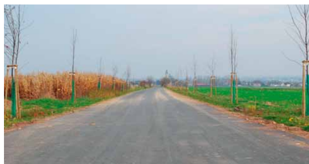
Droga Třebom-Kietrz przed, w trakcie i po budowie