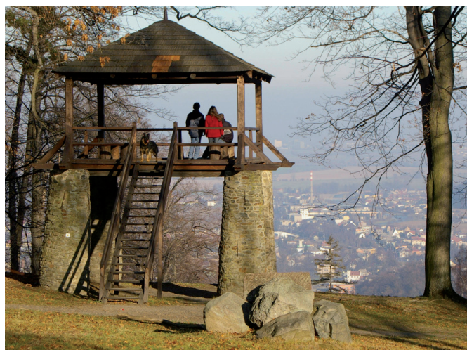
Bezrucova vyhlídka / Punkt widokowy im. Bezrucza, Hradec nad Moravicí