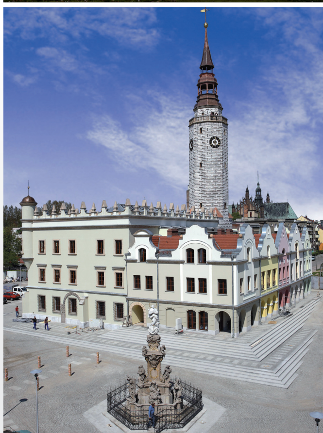
Radnice / Ratusz, Gliwice