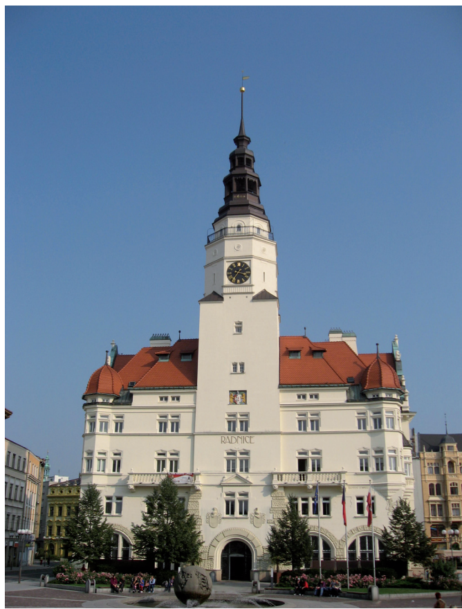
Wież / Wieża „Hláška”, Opava

Zgodnie ze Strategią Rozwoju Euroregionu Silesia na lata 2014-2020 Euroregion rozpoczął w 2016 roku przygotowywanie całościowej koncepcji stworzenia wież i platform widokowych w różnych miejscach Euroregionu Silesia. Na początku ustalono istniejące punkty widokowe i czy gminy, miasta i inne podmioty zainteresowane są stworzeniem nowych punktów. Następnie przygotowano do realizacji 14 nowych wież widokowych po obu stronach Euroregionu, które są stopniowo realizowane. Poprzez połączenie wszystkich istniejących i nowo zbudowanych wież widokowych w jedną całość powstanie nowy transgraniczny produkt turystyczny o nazwie „SILESIAANKA - Szlak wież i platform widokowych w Euroregionie Silesia“.