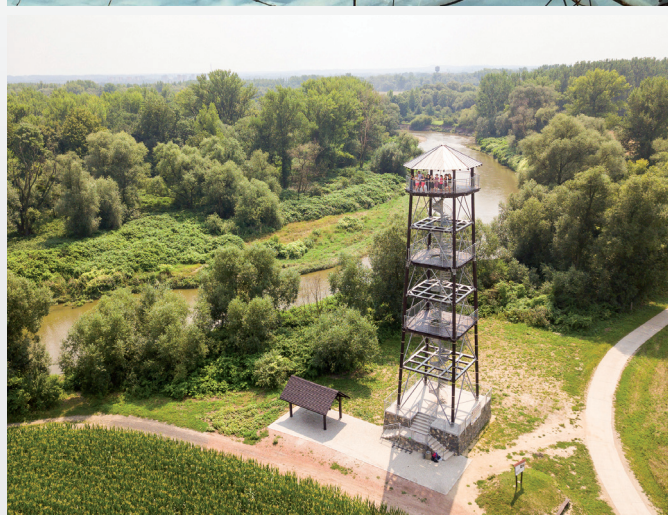
Rozhledna u meandrů řeky Odry / Wieża widokowa przy meandrach rzeki Odry, Krzyżanowice-Chalupek