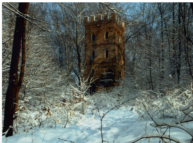
Rytmická bašta / Baszta rycerska, Wodzisław Śląski