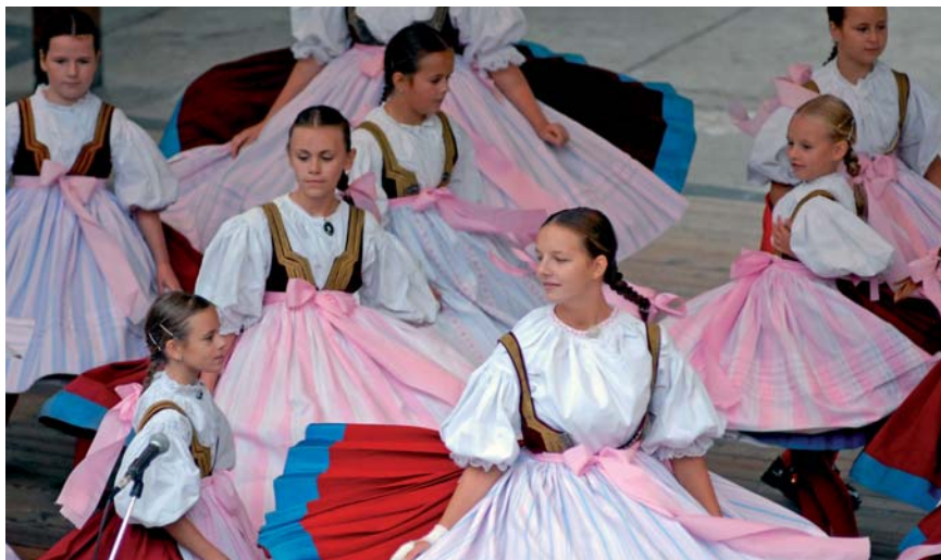
Dziecięcy zespół folklorystyczny Slezanek regularnie uczestniczy w międzynarodowym festiwalu „Dni Śląskie”, który Macierz Śląska organizuje co roku we wrześniu na terenie swojego ośrodka ludoznawczego w Dolnej Łomnej (w Euroregionie Śląsk Cieszyński).