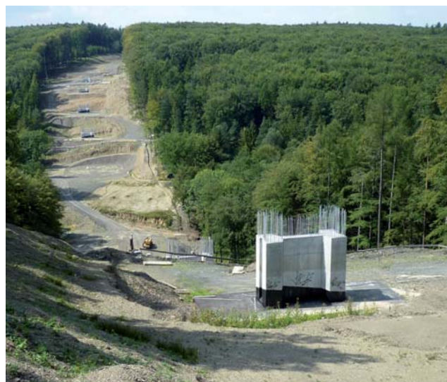
W Mikroregionie Macierz Śląska realizowany jest obecnie jeden z najważniejszych projektów ostatnich czasów – budowa nowej czteropasmowej drogi między Opawą i Ostrawą, która należy do głównej sieci komunikacyjnej nie tylko Euroregionu Silesia, ale całego kraju morawsko-śląskiego. Ta nowa droga łącząca dwa największe miasta euroregionu powinna zostać zakończona w 2015 roku.

region jest również członkiem Lokalnej Grupy Działania Opawsko, a od 2012 roku również Narodowej Sieci Zdrowych Miast.